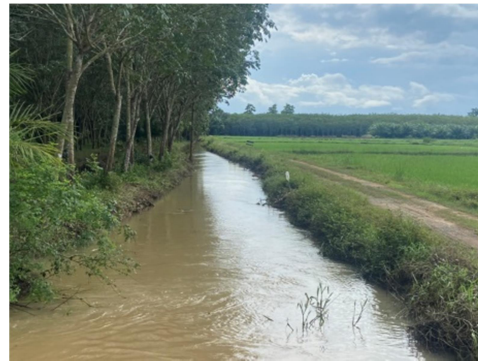
ชุดลอกวัชพืชพร้อมดินเลนคลองสายโคกประดู่ - ถนนรถไฟ หมู่ที่ ๗