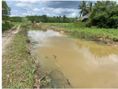
ชุดลอกเหมืองส่งน้ำสายมาบปลวกขาม - มาบยาว หมู่ที่ ๕