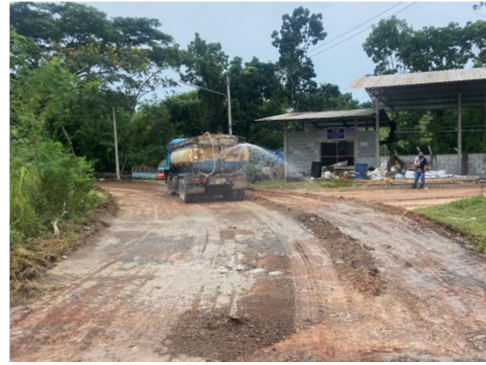
โครงการก่อสร้างถนนคสล.สายกอบอ – ท่าฉ้อ หมู่ที่ ๕ หมู่ที่ ๑๑