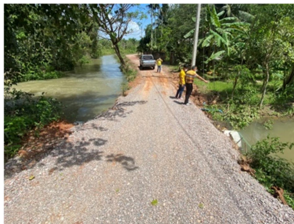
วางท่อระบายน้ำคสล.(มอก.ชั้น๓) ถนนสายโคกไม้ไผ่ - เกาะมัน หมู่ที่ ๗