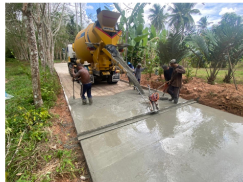
โครงการก่อสร้างถนนคสล.สายสะพานวังบ่อ – มาบathom หมู่ที่ ๗,๘