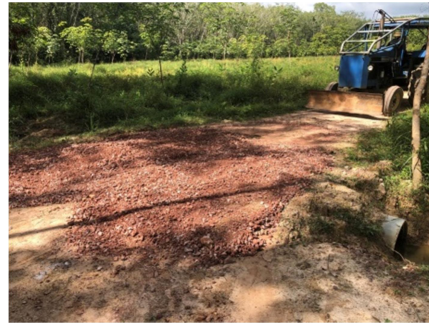
วางท่อระบายน้ำคสล.(มอก.ชั้น๓) ถนนสายเกาะกลมออก หมู่ที่ ๑๒