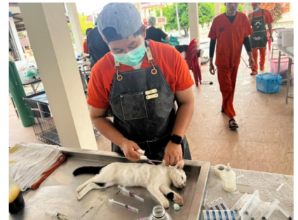
กิจกรรมฉีดวัคซีนป้องกันโรคพิษสุนัขบ้า